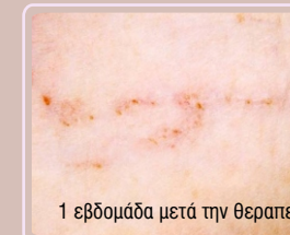
1 εβδομάδα μετά την θεραπεία