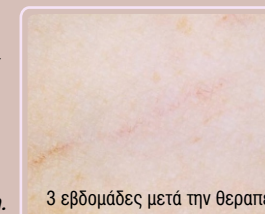
3 εβδομάδες μετά την θεραπεία