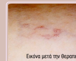
Εικόνα μετά την θεραπεία

Αμέσως μετά την εφαρμογή η ευρυαγγεία εξαφανίζεται, ενώ στα επόμενα λεπτά εμφανίζονται ερυθρές βλατίδες. Το αποτέλεσμα είναι εμφανές μετά από 48 ώρες, όμως τα ίχνη της θεραπείας παραμένουν ορατά για μερικές ημέρες μέχρι και δύο εβδομάδες πριν την οριστική τους εξαφάνιση.